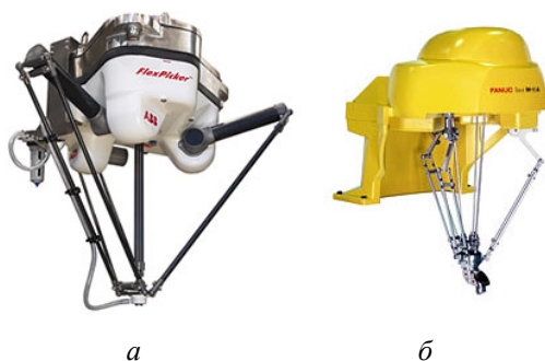
Рис. 1. Промышленные роботы фирм ABB (а) и Fanuc (б)

Комплекс позволит обеспечить заданную технологическую точность без применения прецизионных устройств за счет замкнутой кинематической структуры при снижении себестоимости оборудования на 15...20 %.